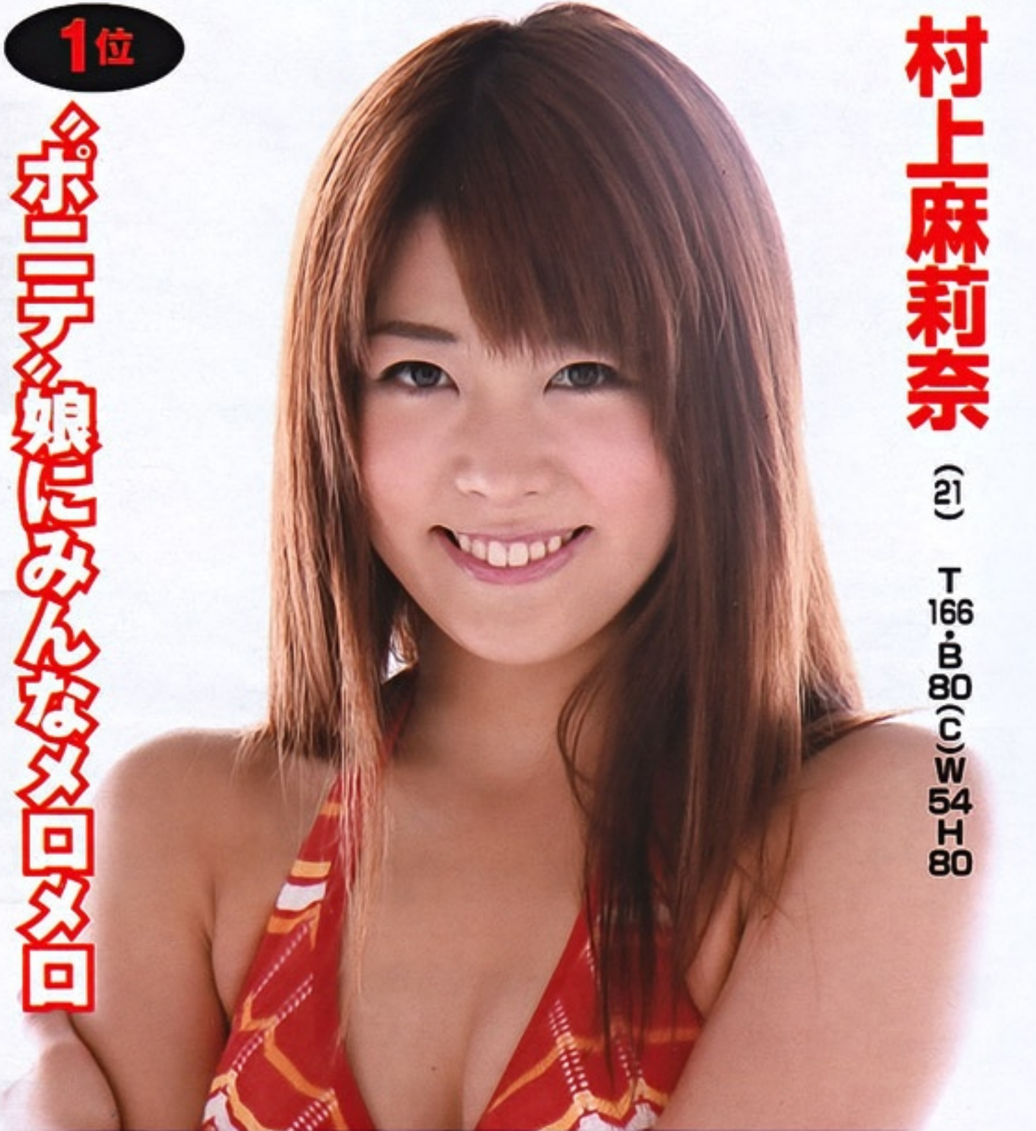
1位 ポニーテールにみんなメモメモ