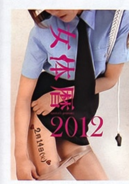
【女体暦2012】日めくりカレンダー付きDVDがポニーキャニオンより発売中 ¥3,990(税込み)

美としての存在に憧れつつ体になってきたことも関係しているでしょう。フェチにハマる男性は、妄想の世界を大事にするロマンチスト。「胸」に惹かれる人は母親のぬくもりや母乳の匂いを求め、「脚」は支配され、従属したいがためのM願望。「尻」は大人の女性そのものを記号化、象徴したものを示しています。今後は今以上に細分化して、唾液やメガネ、あるいは鎖骨などのパーツとは別の部分、また匂いやデイトールなどに興味が移っていくことも考えられます」