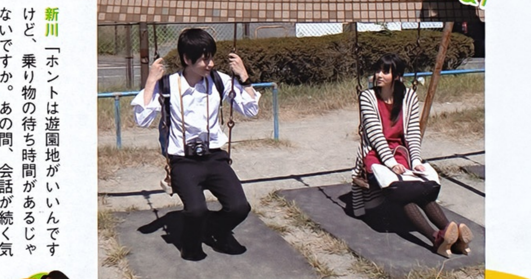
NERDHEAD最新曲「言葉にできないほど好きなのに feat. Mai.K」(10月5日より着うた配信)のPVに出演!